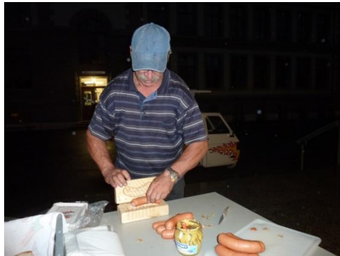
und s'Glepferschnyyd-Apperätli au!