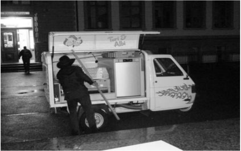
Em Turi sy Wurschwägeli isch d' Sensation vom Oobe gsii...