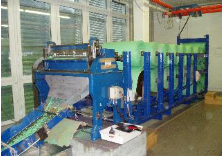
Im Bild oben, die Rapplistanzmaschine der Fa. Hauser AG